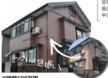
Y様邸100万円 [屋根・外壁]シリコン樹脂塗装仕様

足場代、シーリング打ち換え 高圧洗浄、下地調整、下塗り、 中塗り、上塗りを含んだ料金例です。