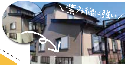
W様邸135万円 [屋根・外壁]高耐候フッ素樹脂仕様