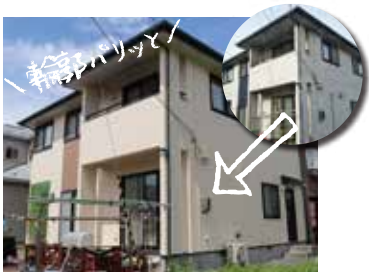
M様邸134万円 [屋根・外壁]高耐候シリコン樹脂塗装仕様